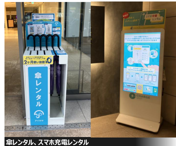
傘レンタル、スマホ充電レンタル