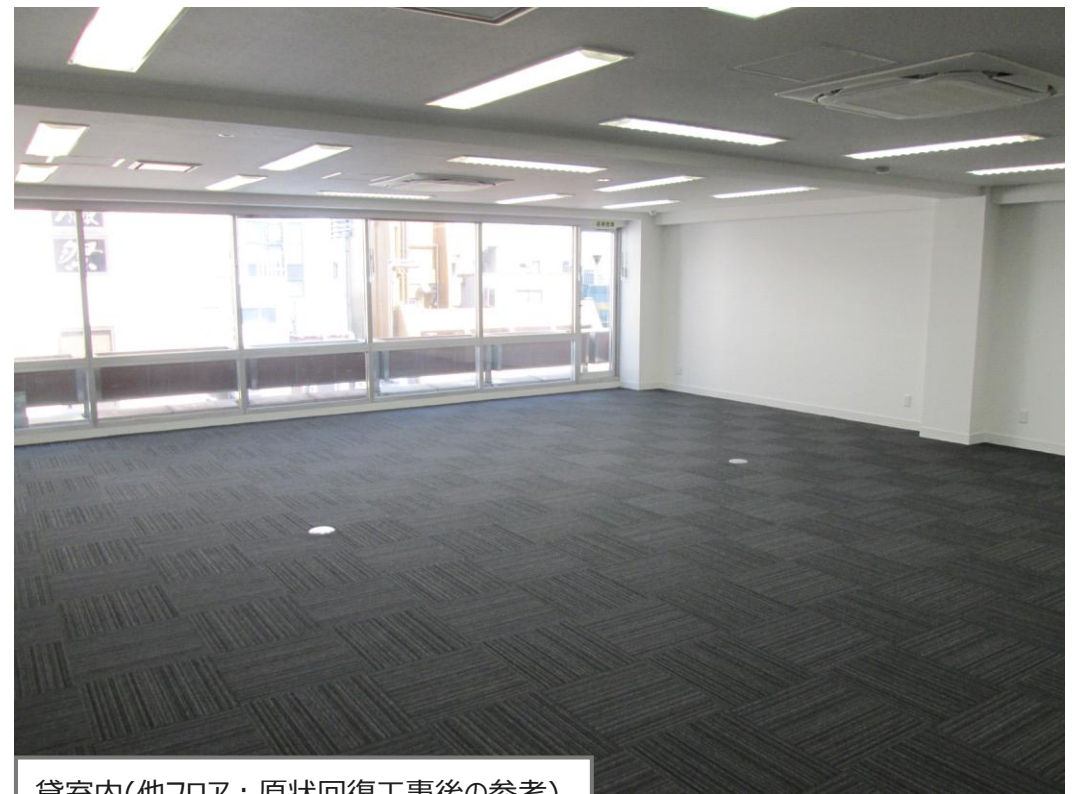
貸室内(他フロア：原状回復工事後の参考)