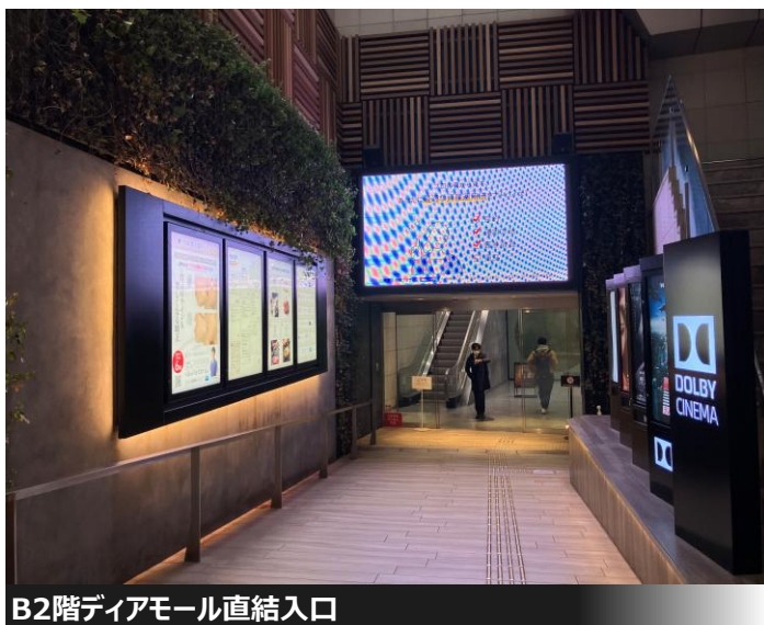
B2階ダイヤモンド直結入口