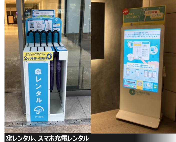
傘レンタル、スマホ充電レンタル