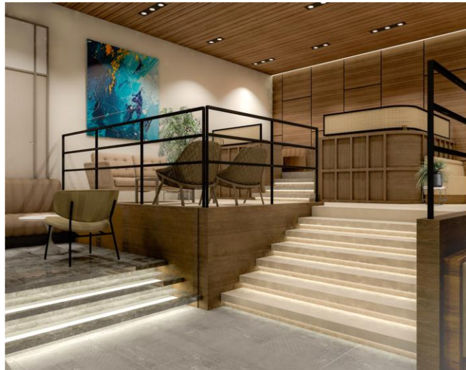
ビジネスラウンジ