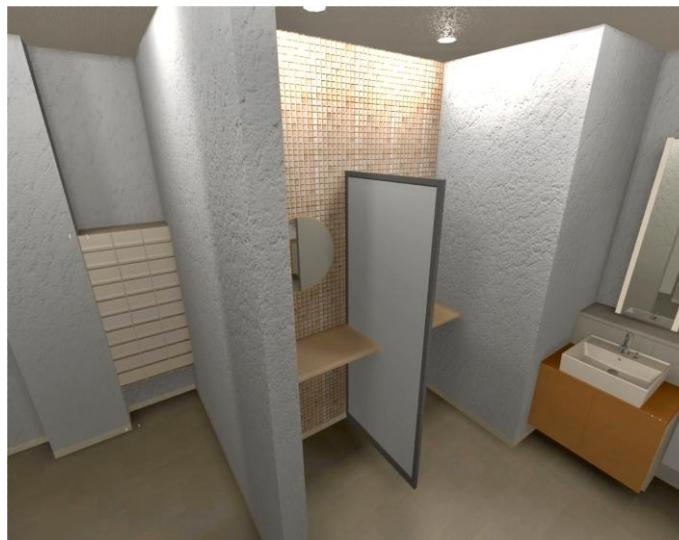
共有部（パウダールーム）