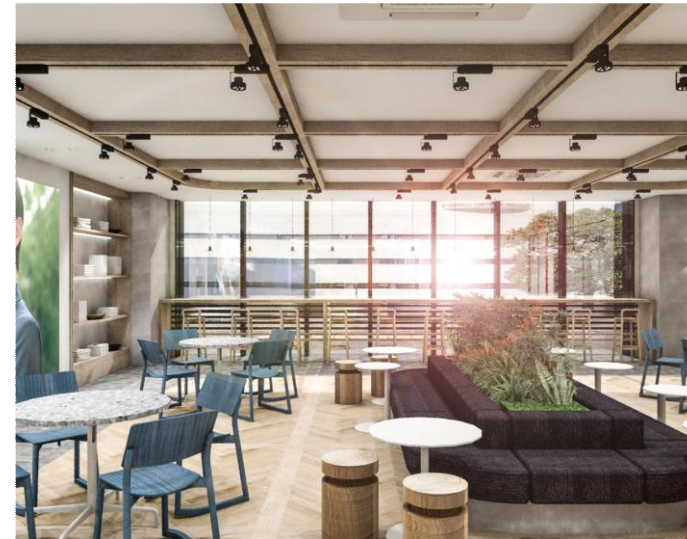
リフレッシュスペース