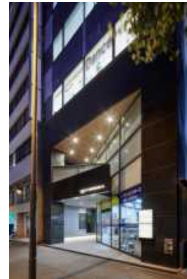
建物入口外観（夜間）