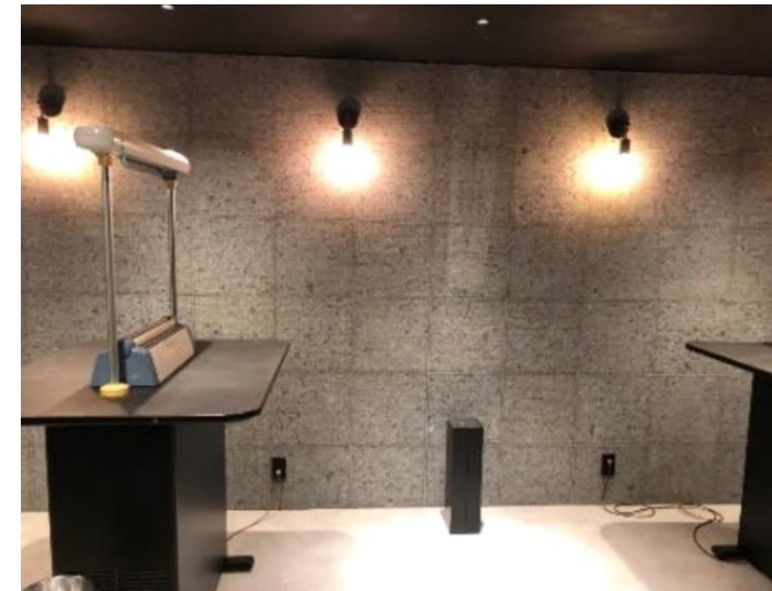
地下1F 喫煙室 (2022年1月リニューアル実施)