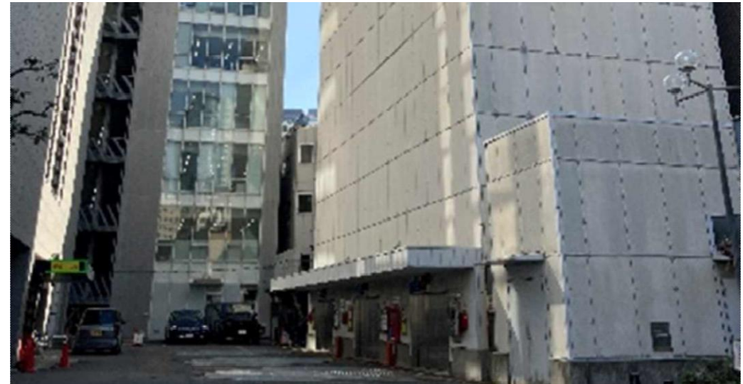
1F タワーパーキング