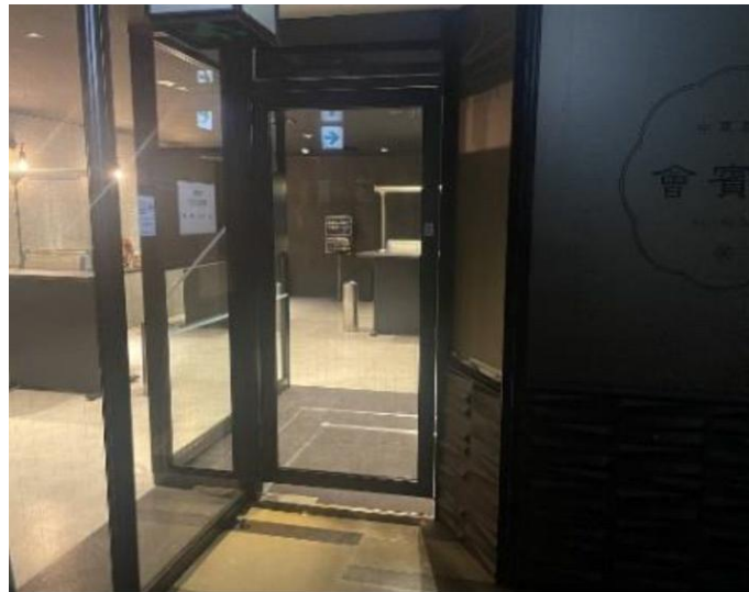
地下1F 喫煙室 (2022年1月リニューアル実施)