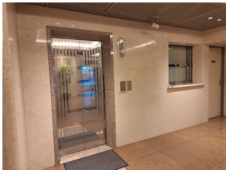
B2階専用エレベーター