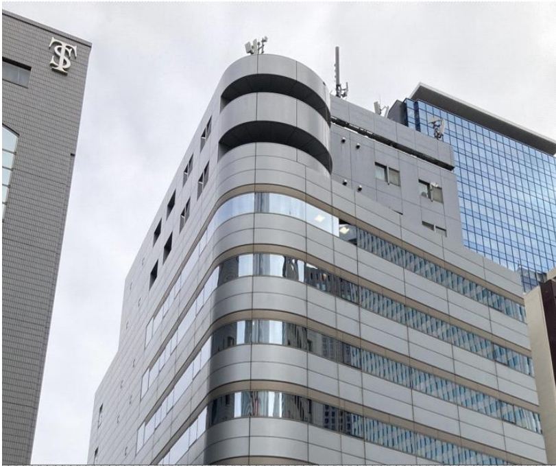
Nishi-Shinjuku DAIKYO Building 西新宿大京ビル