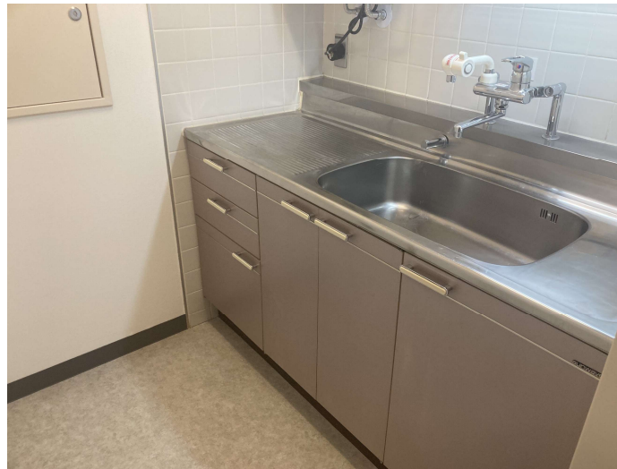
参考 5階 給湯室