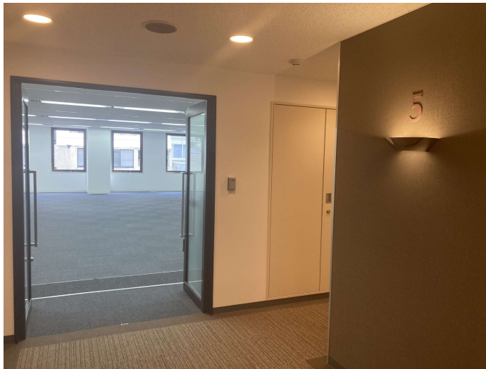
参考 5階 エレベーターホール