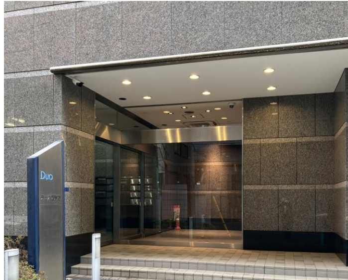
エントランス～自動ドア①