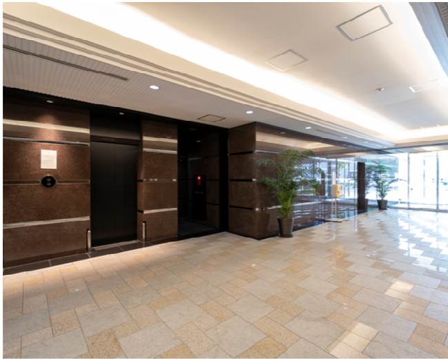
1階エレベーターホール