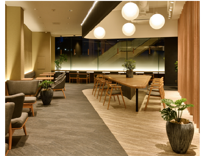
1階テナント専用ラウンジ①