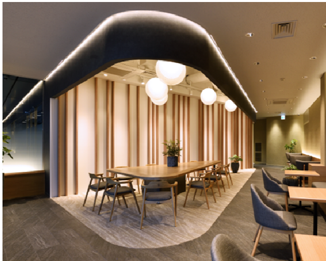
1階テナント専用ラウンジ②