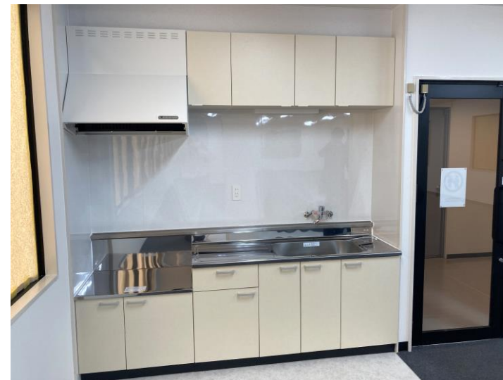
キッチン（各階貸室内）