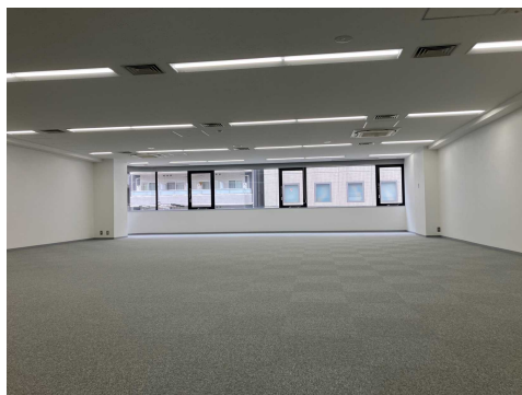
4F 室内 (LED照明・OAフロア)