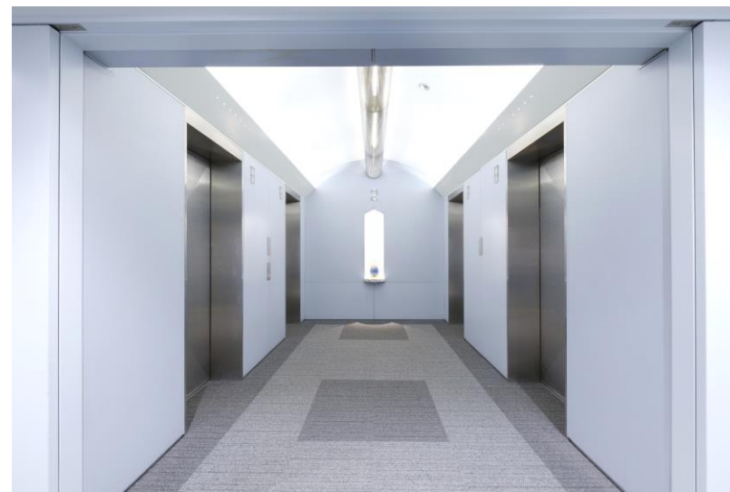
3. エレベーターホール