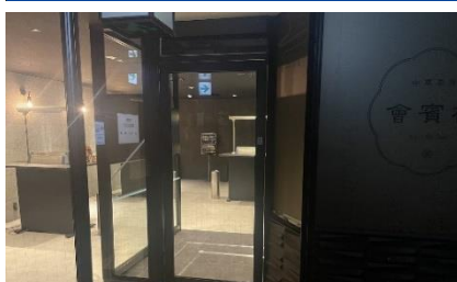
地下1F 喫煙室 (2022年1月リニューアル実施)