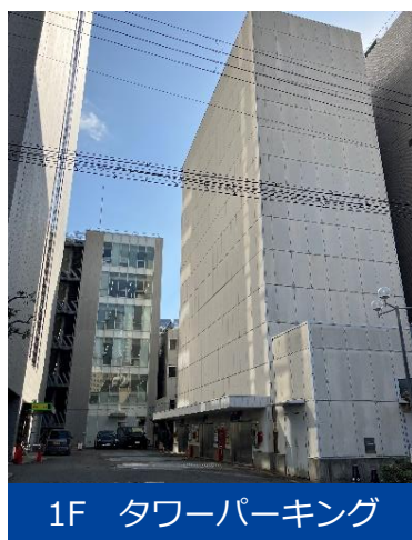
1F タワーパーキング