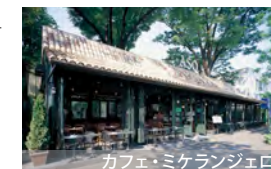
カフェ・ミケランジェロ