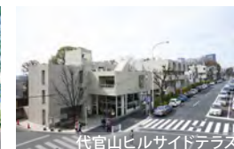
代官山ヒルサイドテラス