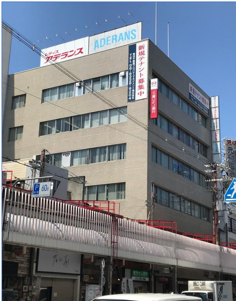
【 外 観 】