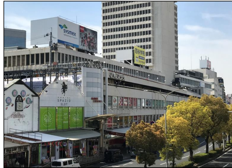
【 外 観 】